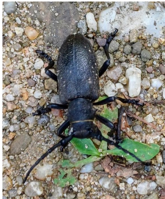
Abb. 1: Lamia textor am 05. Juni 2024 bei Thum & Abb. 2: Lamia textor am 03. Juli 2024 bei Thum

Neue Funde in den Jahren 2023 und 2024 zeigen ein regelmäßiges Vorkommen der Art, die der Autor mit Fotobelegen dokumentiert hat (vgl. Abb. 1 und Abb. 2).